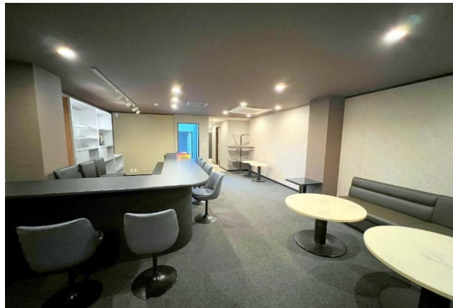
熊本市電「花畑町」徒歩約3分