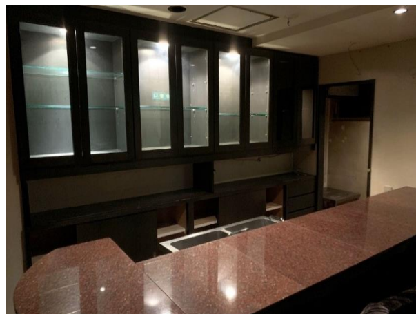
熊本市電「花畑町」徒歩約3分