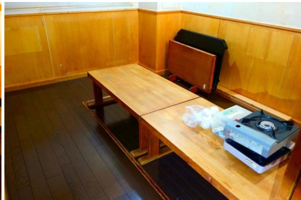
熊本市電「花畑町」徒歩約4分