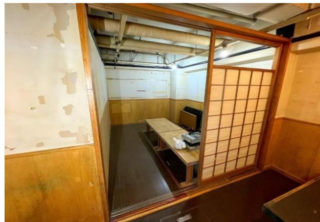
熊本市電「花畑町」徒歩約4分