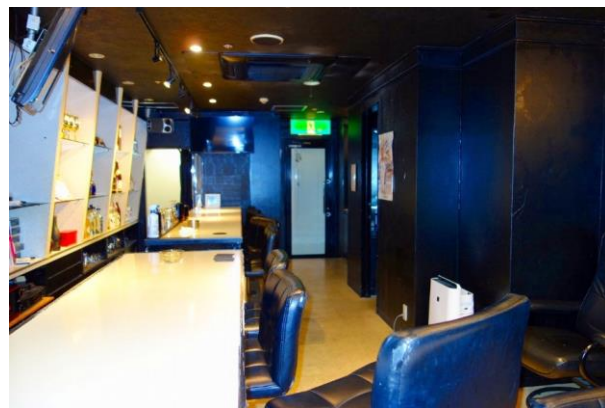
熊本市バス「下通筋」 徒歩3分