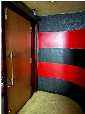
※入口は2箇所となります。