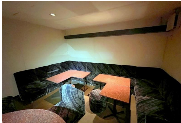
熊本市電「花畑町」徒歩約3分