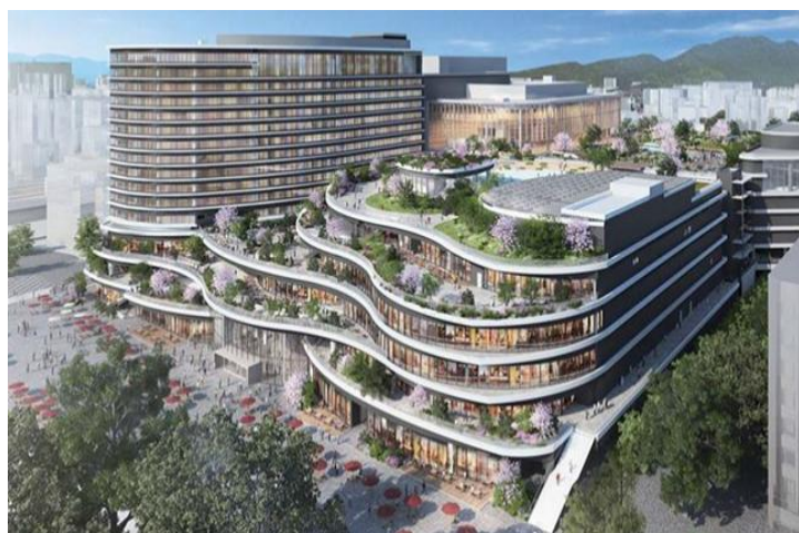
サクラマチクマモト至近！

駐車料：25,000円（税抜）/台+敷金3ヵ月 看板料14,000円（税抜）/区+敷金3ヵ月